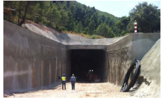
Σήραγγα πρόσβασης σιδηροδρομικής σήραγγας Παναγοπούλας