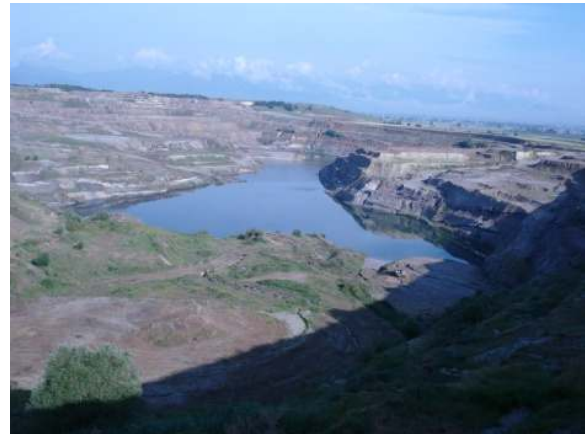
Σύγχρονη άποψη της περιοχής του λιγνιτωρυχείου Βεύης