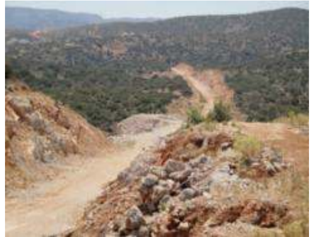
Γενική άποψη ορυγμάτων - επιχωμάτων