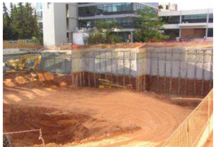
ΒΑ άποψη της κατασκευής