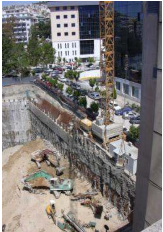
ΒΑ άποψη της κατασκευής