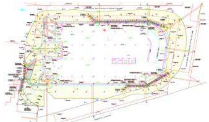
Κάτοψη εκσκαφών κτιρίου